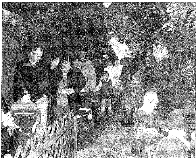
Comme toujours, on se presse pour découvrir la nouvelle décoration dans le tunnel du Pays de Noël.